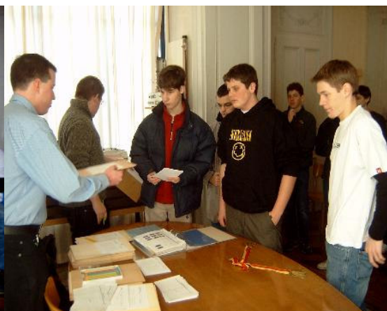
Remise des diplômes et des prix du championnat