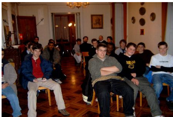
Discours de fin de session

consomment l'information comme un passe-temps. La simplicité et la profusion d'informations à disposition sur internet font perdre les notions de hiérarchisation, la question du crédit de la source et du nécessaire travail de synthèse qui permet de digérer et d'intégrer une information. Ces problèmes de société actuels rejaillissent indirectement sur le cours. Par la suite, il conviendra de trouver une nouvelle façon d'enseigner, mieux appropriée. Grâce au renouvellement régulier des moniteurs et des aide-moniteurs, la solution pourrait bien s'imposer par elle-même.