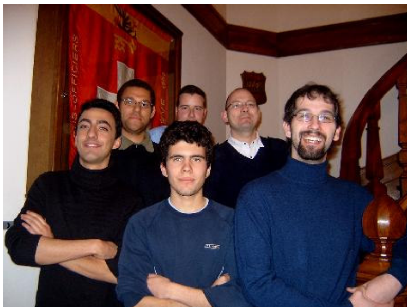
Photo de groupe devant la maison du général Dufour où se déroule la cérémonie de remise des diplômes.