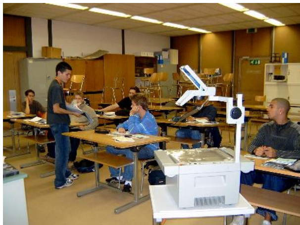
Classe degré I/II

L'exercice de cette année est marqué par une plus faible participation. Depuis plusieurs années, on observe un phénomène de vagues dans le nombre de participants où une année creuse succède à une année faste. Pour cette année, ce constat n'est probablement pas la conséquence d'un désintérêt des élèves pour l'aviation. En distribuant les inscriptions avec la brochure d'information militaire, la société a certes réalisé des économies substantielles, mais la fréquentation n'est pas aussi massive qu'avec l'envoi de lettres individuelles. Nous reviendrons donc à cette méthode l'an prochain. En ce qui concerne les résultats, ils semblent se maintenir au niveau de ces dernières années.