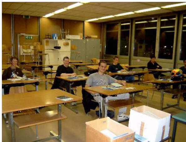
Classe degré III