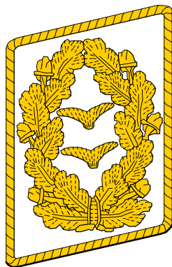
General der Flieger General der Flakartillerie General der Ln-truppe General der Fs-truppe